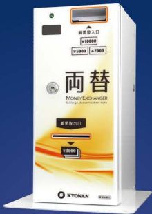
[ 10BD ] 卓上用台座 (標準)