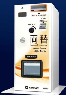
[ 10HS ] 卓上用台座 (標準)