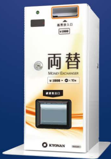
[ 10H1 ] 卓上用台座 (標準)